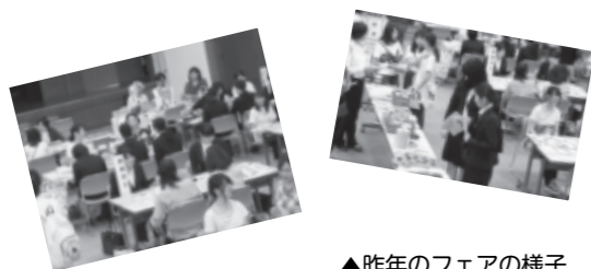
▲昨年のフェアの様子

日時 5月25日(土) 13:00～15:30 場所 ビバシティ彦根（竹ヶ鼻町）2階ビバシティホール 問い合わせ先 園幼児課 ☎23-9597、FAX26-1768