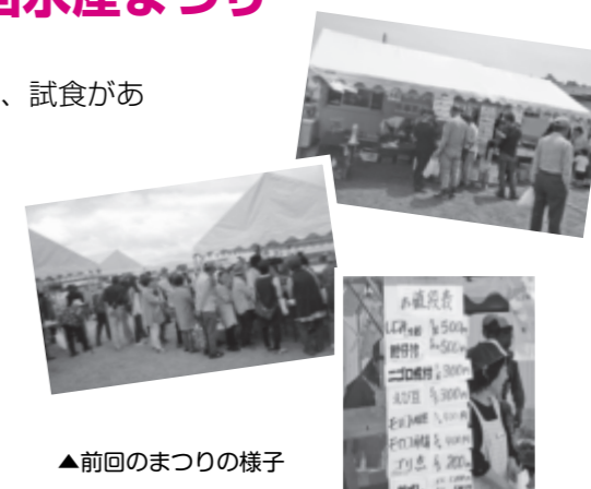
▲前回のまつりの様子

日時 5月19日(日) 9:00～12:00 場所 宇曾川漁港 宇曾川河口（須越町） ※販売商品が売り切れた時点で終了します。 ※小雨決行（雨風など警報発令時は中止） 問い合わせ先 彦根市磯田漁業協同組合 ☎25-1460 （月・水・金曜日9:00～12:00）