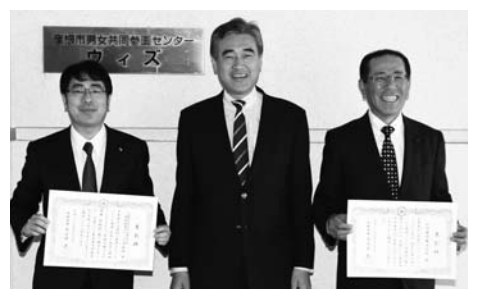
▲谷庄建設株式会社(写真右)と新教育総合研究会株式会社(写真左)の代表取締役が表彰状を受け取られました。

市では、男女共同参画社会の実現に向けて、積極的に取り組んでいる事業者を表彰しています。選考の結果、次の2事業者を表彰しました。 問い合わせ先 困危機管理室 ☎30・6150番、FAX 23・1777番