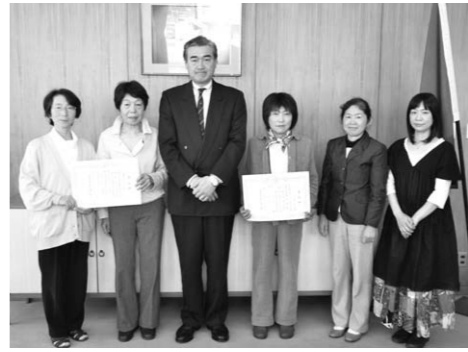
マルホ株式会社彦根工場の皆さん