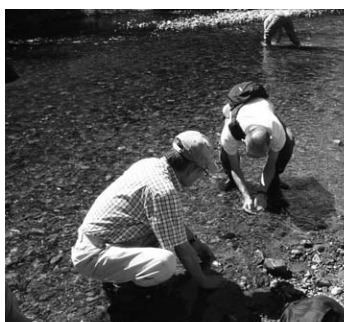
▲昨年の水生生物の観察

内容 私たちの周りにある身近な水に関する環境問題について、一緒に考えてみませんか。初回は「あちらを立てればこちらが立たず」琵琶湖水系の治水・利水・環境を診る」と題して専門家の講演を聞きます。そのほか、さまざまな角度から学べる講座です。 日程 下表のとおり 対象 市内に在住の人 定員 25人(先着順) 費用 無料。ただし、8月8日(土)のフィールドワークの昼食代は自己負担となります。 申込開始日 5月15日(金) その他 全ての講座に出席した人は、彦根市環境保全指導員資格が取得できます。 申込・問い合わせ先 彦根市環境保全指導員連絡会議事務局(圃生活環境課内) 30・6116番、FAX 27・0395番