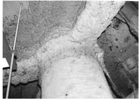
▲出所 国土交通省資料 「一回で見るアスベスト建材ヘルパー」

左の写真のような事例がありましたら、お問い合わせください。 問い合わせ先 困建築指導課 ☎30・6125番、FAX 24・8517番