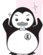
▲更生ペンギン「ホゴちゃん」