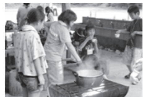
▲前回のキャンプの様子

＜内容＞野外活動を通して、自然に親しむことを目的にキャンプをします。テント泊、野外炊事、キャンプファイヤーなどわくわくドキドキの2日間を過ごしませんか。＜日時＞8月13日(水)午後1時～同14日(木)午後3時30分 ＜場所＞困荒神山自然の家(日夏町) ＜対象＞小学4年生から6年生 ＜定員＞30人程度(先着順) ＜参加費＞3千円(自炊材料費などを含む) ＜申込期間＞7月15日(火)～同31日(木) ＜申込方法＞電話またはFAXで申込受付後、参加者には、詳しい