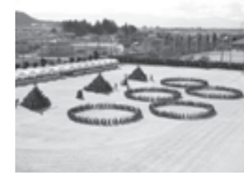
▲体育大会マスゲーム

問い合わせ先 困教育委員会学校教育課 ☎24・7973番、FAX 23・9190番