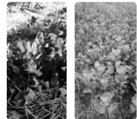
▲ハマエンドウ ▲ハマゴウ

琵琶湖岸にハマゴウ、ハマエンドウという海辺に生育する希少な植物が新海浜にも生えています。しかし、近年では、レジャー客による踏みつけや土木工事、自然災害などの影響により、その数が激減し、滋賀県の絶滅危惧種や絶滅危惧増大種に指定される状態です。 そのような状況を見かねた地元のボランティアが、地道な保護活動を行い、現在では良好な状態を保つようになりました。 これらのことから、滋賀県では砂浜の環境変化を防ぎ、生態系を保護することを目的として、平成26年3月31日に「新海浜ハマゴウ・ハマエンドウ群落生育地保護区」を指定しました。 問い合わせ先 両まちづくり推進室 進室 ☎30・6117番 FAX 22・10300番