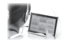
▲タッチパネルを使った脳の健康チェック

※電話かFAXで、①氏名②年齢③連絡先④希望する時間帯を伝えて申し込んでください。