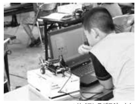
▲サイエンスプロジェクト

困 子どもセンターには、屈折式200mm口径の大型望遠鏡のほかに、小型望遠鏡などが設置されています。同センターでは、今年もこの望遠鏡を使った天文クラブの活動や星空教室などを企画しています。