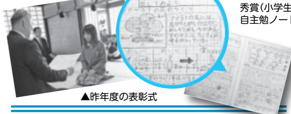
▼昨年度の最優秀賞(小学生)の自主勉ノート

内容 家庭での自主学習や、継続している取り組みを表彰します。 対象 市内在住の小・中学生 部門 ①「マイ☆1」家庭での自主勉ノート部門(個人の部、団体の部)、②「マイ☆2」ずっと続けてがんばっている部門 提出物 ①自主勉強ノート1冊②成果が分かるもの(ノートや作品) 応募期限 12月14日(金)(必着) 問い合わせ先 困教育委員会学校教育課(〒522-0001 尾末町1-38) ☎24-7973、FAX23-9190 ※提出するノートや作品に、①住所②氏名③電話番号④学校名⑤学年⑥応募部門⑦作品の見どころ(保護者による記入可)を記入した応募票を貼付して郵送または直接窓口へ提出してください。応募票は各学校でもらうか、彦根市ホームページからダウンロードしてください。