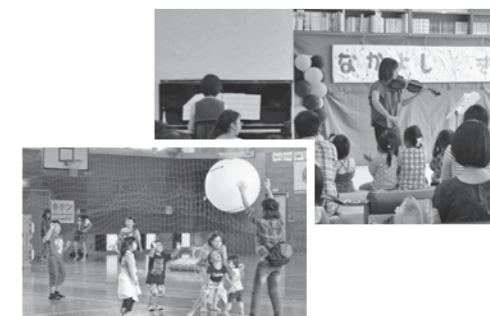
◀昨年のフェスティバルの様子

対象 中学生以下 ※整理券が必要なコーナーがあります。 その他 前日(7日(土))は15:00に閉館します。また、当日の開館時間は10:00~14:30です。当日に遊具の貸し出しはできません。 問い合わせ先 困子どもセンター☎28-3645、FAX28-3646