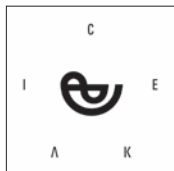
▲CEKAI(クリエイターチーム)