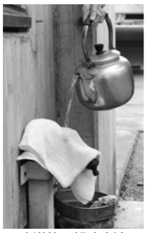
▲水道管の解凍方法

タオルをかぶせて、その上からぬるま湯をゆっくりかけて氷を溶かしてください。※熱湯は絶対に使わないでください。水道管が破裂することがあります。