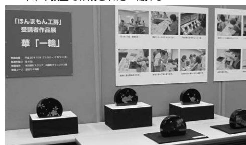
▼昨年の教室で作成された一輪挿し

彦根仏壇の技術を学ぶ 「伝統工芸教室」受講者 〈内容〉彦根仏壇の伝統工芸士から仏壇を製造する技術を学ぶことができる教室です。各