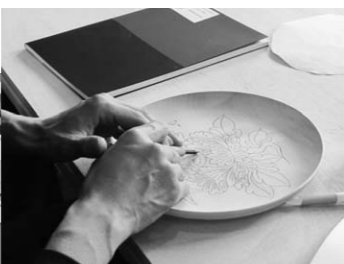
▲彫刻コースの様子

コースの内容、開催日時、受講料(材料費、道具・器具の使用料を含む)は上表のとおりです。〈受講場所〉彦根商工会議所(中央町) 〈申込期限〉平成27年1月15日(木) 〈申込問い合わせ先〉彦根仏壇事業協同組合 ☎24・4022番、FAX26・0559番 ※電話かFAXで、①住所②氏名③年齢④電話番号⑤希望コースをお知らせください。