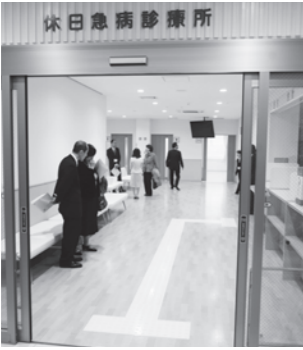
くすのきセンター内の休日急病診療所

平成26年2月に休日急病診療所がくすのきセンターに移転し、救急医療についての住民啓発に努めたことにより、診療所の利用者数が大幅に増加しました。