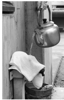
▲水道管の解凍方法

タオルをかぶせて、その上からぬるま湯をゆっくりかけて氷を溶かしてください。 ※熱湯は絶対に使わないでください。水道管が破裂することがあります。