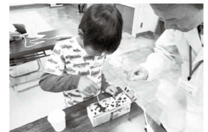
どんなふうパンが焼けるのかな

内容 牛乳パックと電流で、パン作り体験をしよう。 日時 10月27日(日) 13:30～15:00 対象 小～中学生(小学生は保護者同伴) 定員 10人(先着順) 費用 300円 申込期間 10月5日(土)～同16日(水)