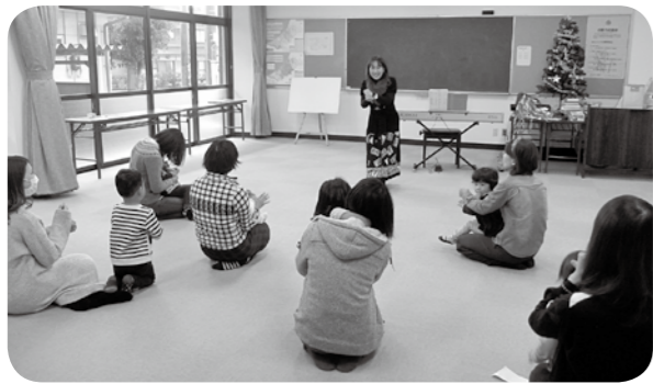
▲過去の開催の様子

令和2年度鳥居本学園(小中一貫型小・中学校)新入学生 内容 鳥居本学園(小中一貫型小・中学校)に入学する児童・生徒を募集します。〈対象〉市内に住居登録のある令和2年度小学校入学生・中学校入学生。〈定員〉各20人程度。〈申込期間〉12月9日(月)～令和2年1月21日(火)。〈その他〉詳しくは、お問い合わせページをご覧ください。〈申込・問い合わせ先〉 囲教育委員会学校教育課 ☎24-7973番、FAX23-9190番