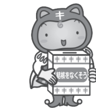
▲複十字シール募金運動イメージキャラクターシールぼうや

昨年11月から年末にかけて、結核を予防する事業の推進のために、複十字シール募金運動を行いました。