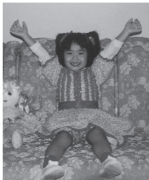
▲フェスタ・ジュニーナの服装をした子どもの頃の私

また、祭りが行われる6月は冬のため(ブラジルで6月は冬です)、「ケントン」というサトウキビの焼酎に、生姜、オレンジの皮、シナモンやキャラメルなどを入れて温めたものが大人気です。とてもおいしいので、フェスタ・ジュニーナへ行く機会があれば、ぜひ試してみてください。