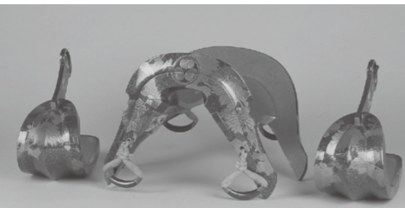
▲黒漆塗莢紋蒔絵鞍・鐙

■【休館日のお知らせ】9月1日(火) ■8月18日(火)~20日(木)は、展示替えのため一部休室します。