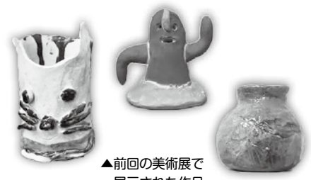
▲前回の美術展で展示された作品

📞 (社福)とよさと ステップあっぷ 21 ☎ 35-0333 📠 35-2123