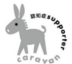
▲認知症サポーター キャラバンマスコット ロバ隊長