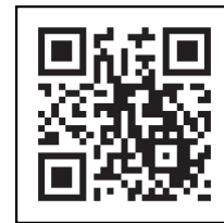
“新冠疫苗导航站” 二维码