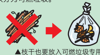
▲枝干也要放入可燃垃圾专用袋