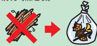
▲枝干也要放入可燃垃圾专用袋