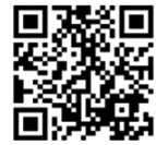
テクノカレッジ ホームページ

对象：求职中的人（面向未经验者） 定员：米原校：NC（数控）加工工程师科 10 人，电气设备工程师科 15 人，住宅翻新装修科 10 人 费用：不需要缴学费。但需要购买课本和工作服。 报名期：截止到 5 月 15 日（周五）在“ハローワーク”（公共职业介绍所）受理 其他：详细信息，请扫描二维码。 询问：テクノカレッジ米原（高等技术专科学校米原分校）☎ 0749-52-5300