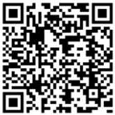
← “キキクル”危险性分布地图

新标准以 5 个预警等级和依预警等级应做的行动内容构成，易于把握危险程度和避险行动要求。如果政府或气象厅发表 3 级警报或 4 级危险警报，请立刻确认彦根市的最新避险通知，以确保自己的人身安全。通过应用软件（例如“キキクル”危险性分布地图）提前了解河川水位也很重要。灾祸不可预测。我们建议大家平时与家人、友人、同事等商量决定应急状况下如何行动。