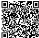
← 气象厅（有中文页面）

询问：危機管理課 （危険管理課） ☎ 0749-30-6150 传真 0749-23-1777