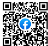
彦根市多文化共生脸书公众号

彦根市人权政策课 多文化共生系通过“脸书 Facebook” 及时发出与日常生活有关系的各种信息。 希望大家注册・跟踪！ 请您通过您常用的社交网与好友共享我们脸书的信息。