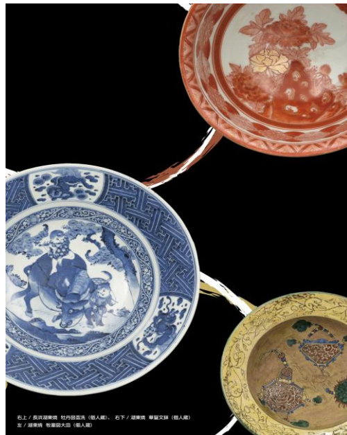
右上 / 萩焼 萩焼 萩焼 (個人蔵)、右下 / 萩焼 萩焼 萩焼 (個人蔵) 左 / 萩焼 萩焼 萩焼 (個人蔵)