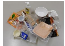
Bao bì nhựa

Nếu phân loại có thể tái sử dụng như tài nguyên!