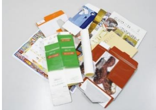
Giấy cũ (hộp sữa, giấy linh tinh, tạp chí, v.v.)

Chẳng hạn như bạn có vứt những thứ dưới đây không?