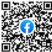
Trang Facebook tiếng Việt