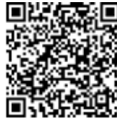
Trang Web thành phố Hikone