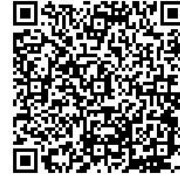
Trang tạp chí Bản tin cộng đồng Koho Hikone