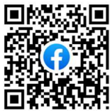
彦根市多文化共生脸书公众号

每周二及周五有口译员。口译员不在岗日可以通过视频提供远程口译服务。 若是您需要口译服务，请给1楼总接待处的工作人员看「中国語」这一词。