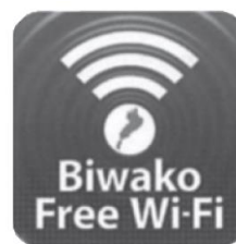
Logomarca de WI-FI gratuito

Maiores detalhes Prefeitura Setor Jouhou Seisaku ka tel 22-1398