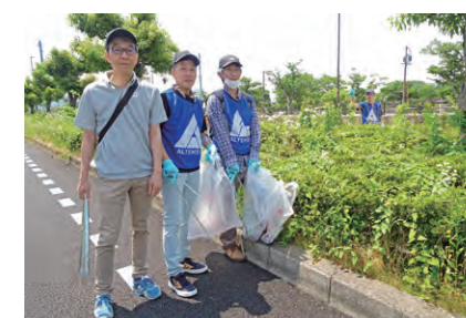
平和堂HATO スタジアム周辺