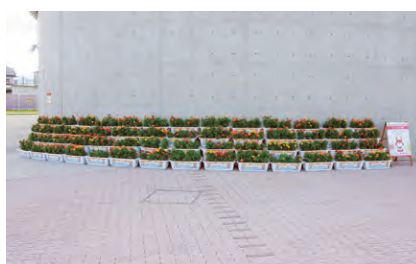
プロサウンドアリーナ HIKONE