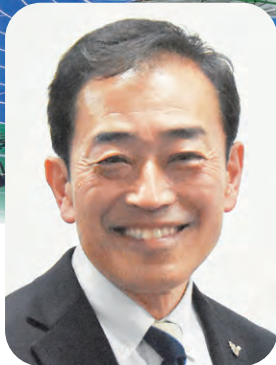
わた SHIGA 輝く国スポ・障スポ 彦根市実行委員会 会長