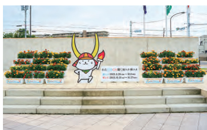
プロサウンドアリーナ HIKONE