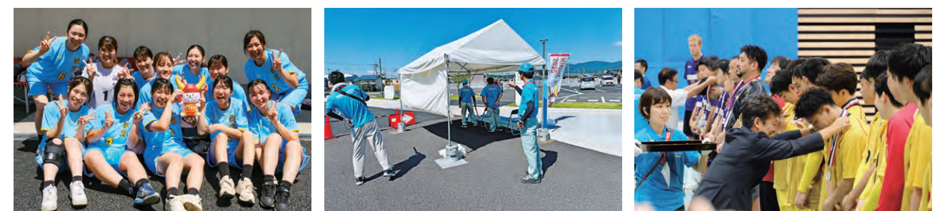
滋賀県選手団（成年女子）