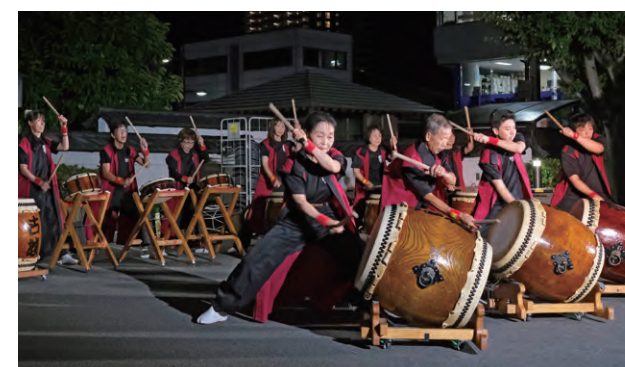
ステージパフォーマンス 彦根古城太鼓