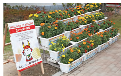
彦根グリーンアリーナ