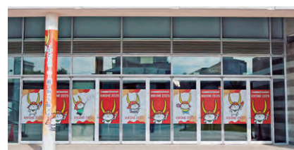
柱巻看板と窓ラッピング