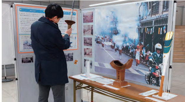
炬火トーチ・受皿の展示

44年前の1981年に開催された「びわこ国体」の当時の写真や資料などを展示しました。