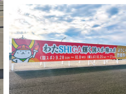
彦根インター前看板