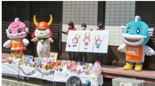
令和5年4月13日 ひこにゃん誕生日セレモニー