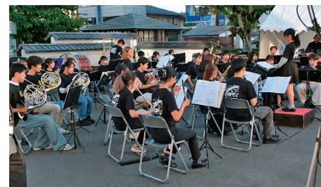
ステージパフォーマンス 滋賀県立大学吹奏楽部