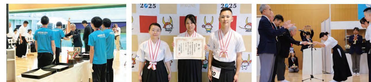
表彰の準備をする係員