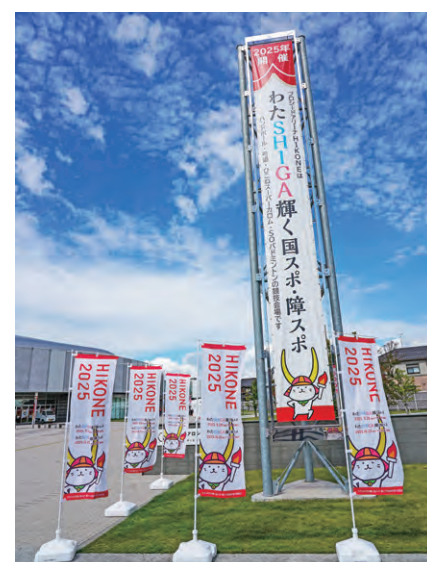
のぼり旗・懸垂幕