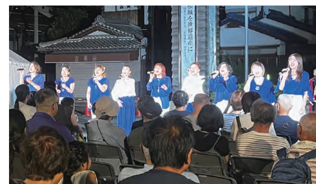
ステージパフォーマンス human note