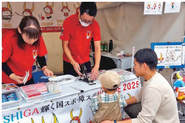
令和6年11月1日 物産展 PR ブース