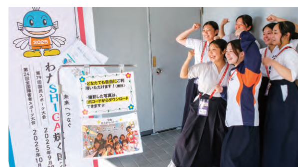
写真を撮るなぎなた選手

パナソニック株式会社くらしアプライアンス社彦根工場様の提供により、ひこにゃんやキャッフィー、チャッフィーのオリジナルフレーム写真が撮影できる機器やタッチパネル式のデジタル案内板を市役所や競技会場内に設置しました。