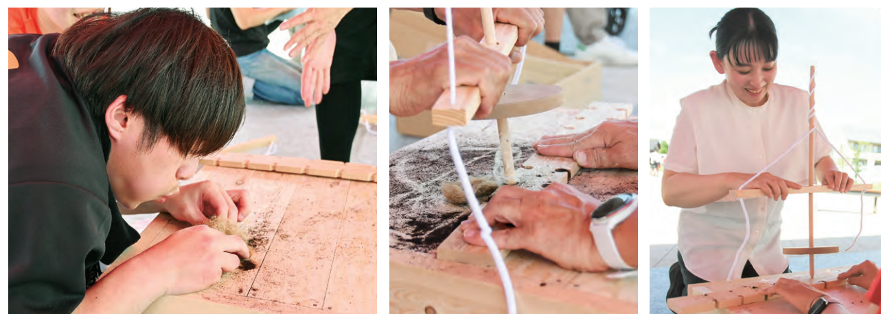
火種から火を起こす様子