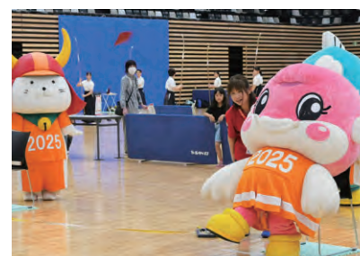
ビーンバッグ投を体験するチャッフィー