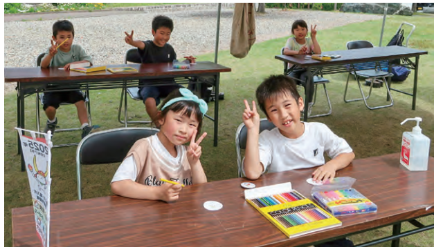
令和4年5月5日 荒神山公園春まつり

広報ボランティアの皆さんにもご協力いただき、市内で開催された各種イベントへのブース出展や啓発物品の配布、ステージパフォーマンスなどを行いました。