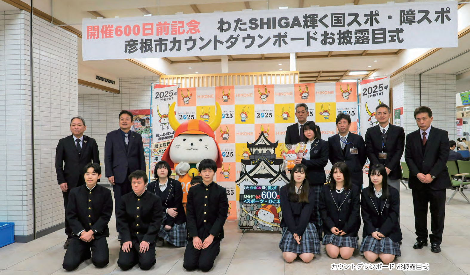
カウントダウンボード お披露目式