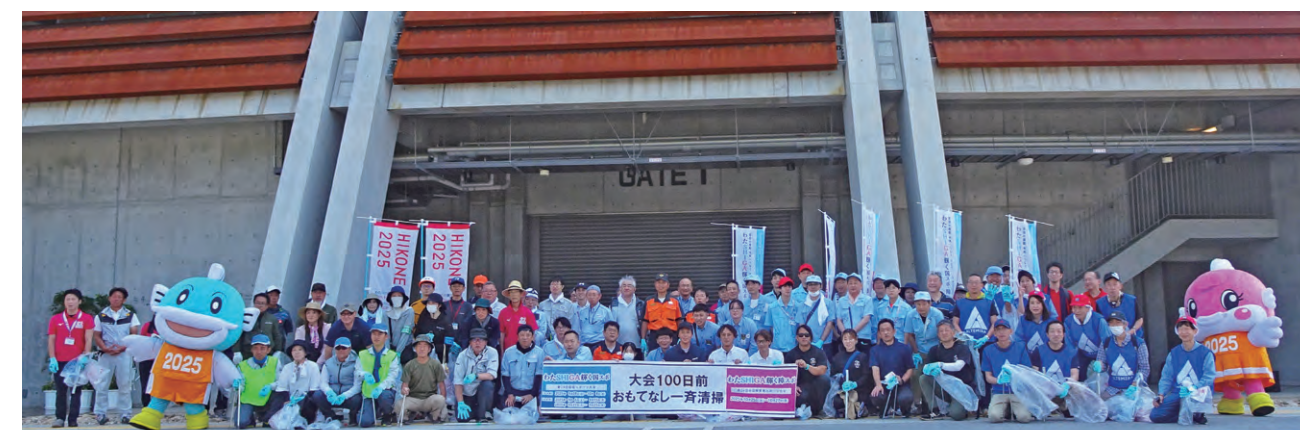
平和堂HATO スタジアム