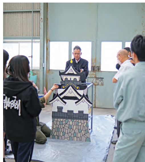
製作中のカウントダウンボード