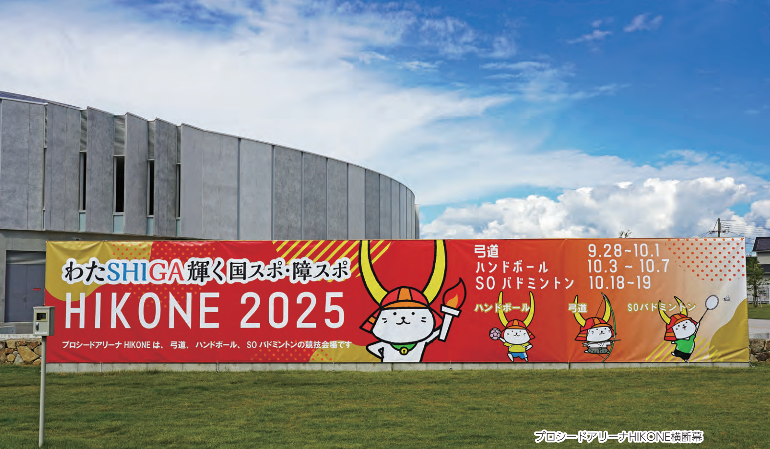
プロシードアリーナHIKONE横断幕