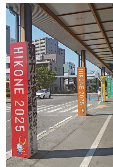
彦根駅前ロータリー柱巻き看板