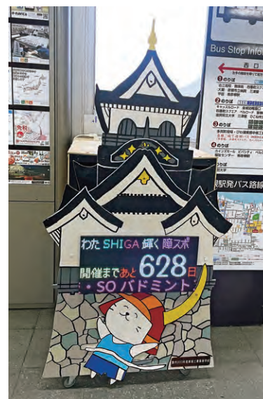
彦根駅に設置したカウントダウンボード

滋賀県立彦根工業高等学校の皆さんに両大会開催までのカウントダウンを行うカウントダウンボードを製作いただき、開催 600 日前から市内 3 カ所に設置しました。