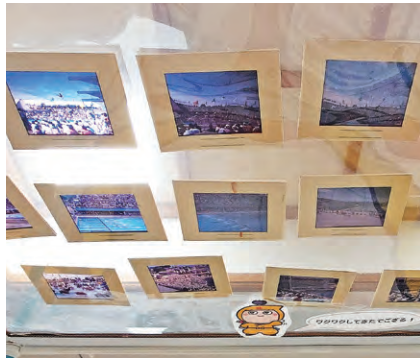
当時のポスターフィルム