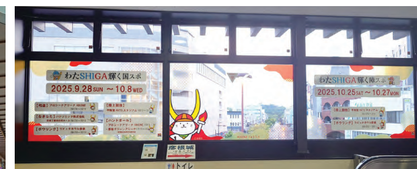
彦根駅窓ガラスシート