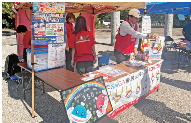
令和6年10月13日 ひこねいろ文化祭