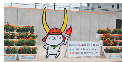
「ひこにゃん」 フォトスポット