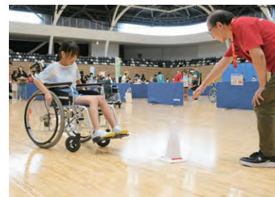
スラローム（障スポ陸上競技）体験