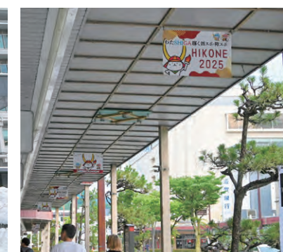
彦根駅周辺アーケードフラッグ