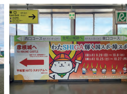
彦根駅改札前看板