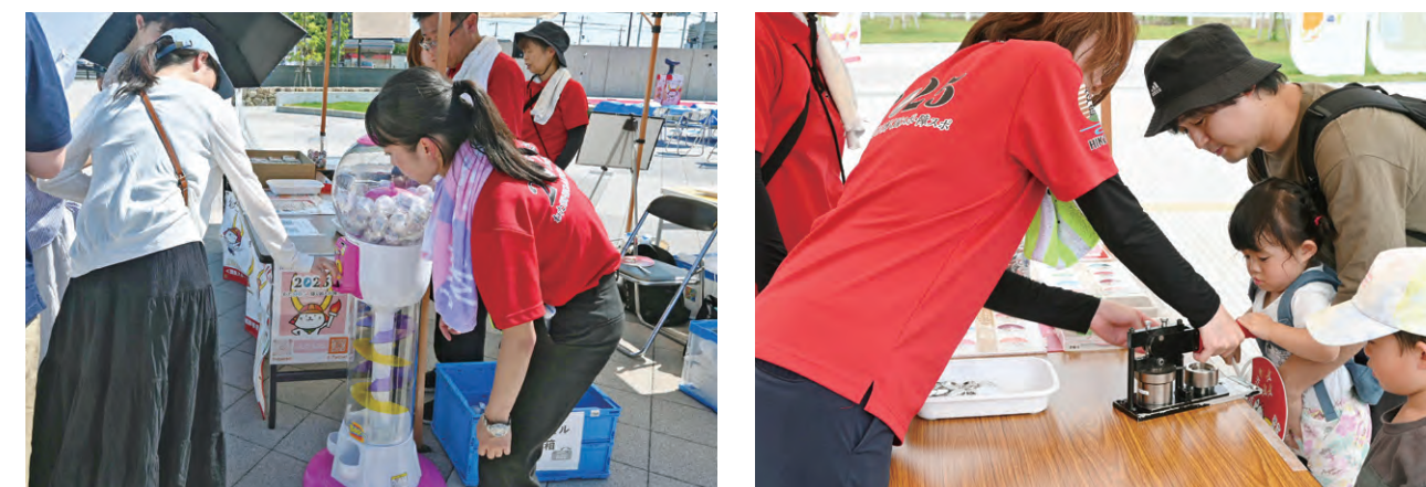
ガチャガチャ 1等はひこにゃんの国スポ・障スポオリジナルぬいぐるみ

缶バッジ製作体験や SNS をフォローすると挑戦できるガチャガチャなど実施しました。