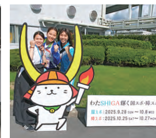
「ひこにゃん」 フォトスポット