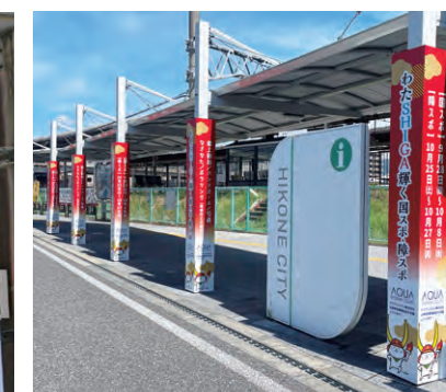
南彦根駅前柱巻き看板