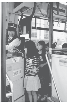
運賃を支払う練習をする児童の様子▶

公共交通（路線バス）とマイカー、それぞれの良いところ、不便なところを学習しました。また、小学校の校内にバスがやってきて、乗り方や運賃の支払い方法を練習しました。