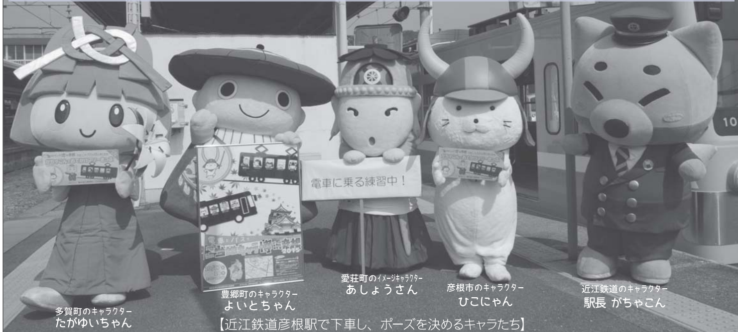
多賀町のキャラクター たがゆいちゃん

全国各地からたくさんのご当地キャラが参加し、盛大に開催されました。 お迎えする湖東圏域のキャラたちは、来場者の方と同じように電車に乗り、公共交通を使っでの来場をPRしました。