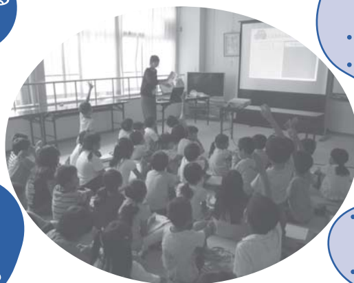
▲積極的に意見を発表する子どもたち