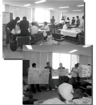
▲ マップをつくるワークショップ