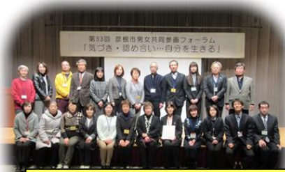
講師を囲んで♪記念の一枚📷

「自分らしく生きる」ということは、わがままを通すことでも、自己中心的な行動をすることでもなく、相手を尊重し、互いを思いやる心を持ち自分を大切に・・・ユーモアあふれる心にスッと入るお話に会場中が感動の渦に包まれました。