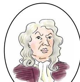
アイザック・ニュートン