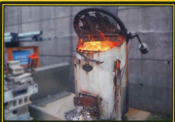
不適合焼却炉での焼却