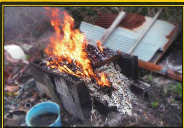
ブロック塀などで囲っての焼却