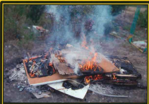
地面や地面に掘った穴での焼却

法律に違反して廃棄物の野外焼却を行った者は、5年以下の懲役 もしくは1,000万円以下の罰金、またはこの併科となります。 (※上記とは別に、法人には3億円以下の罰金刑が科されます。)