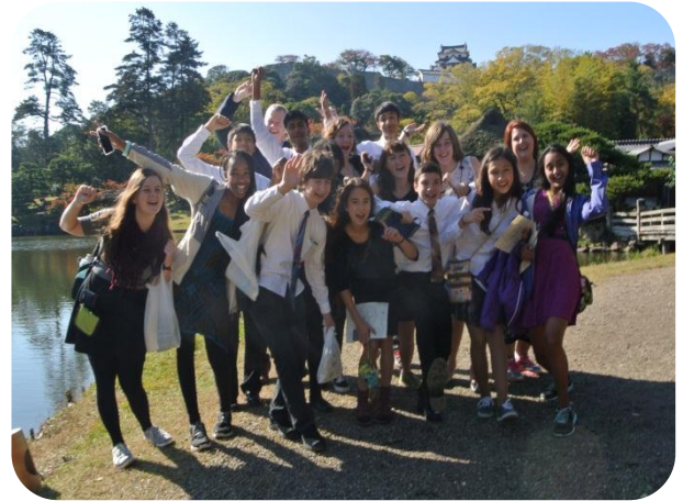
4 ふるさと彦根国際交流事業 アナーバー市中高生と彦根城