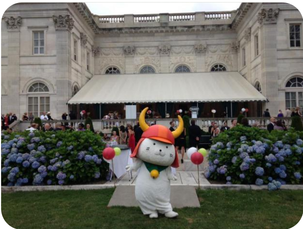
5 みんなのひこにゃん応援事業 「ニューポート黒船祭」でのPR活動の様子