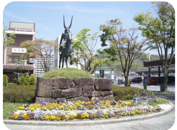
6 ふるさと彦根まちづくり事業 駅前広場樹木の剪定