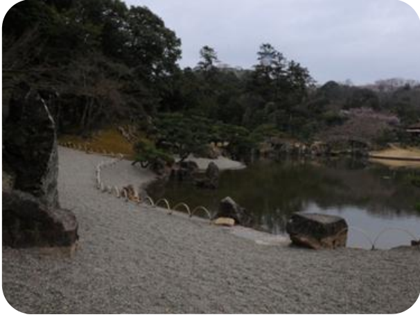
1 ふるさとの誇り保存整備事業 玄宮園護岸保存整備事業（「東濱」州浜の復元）