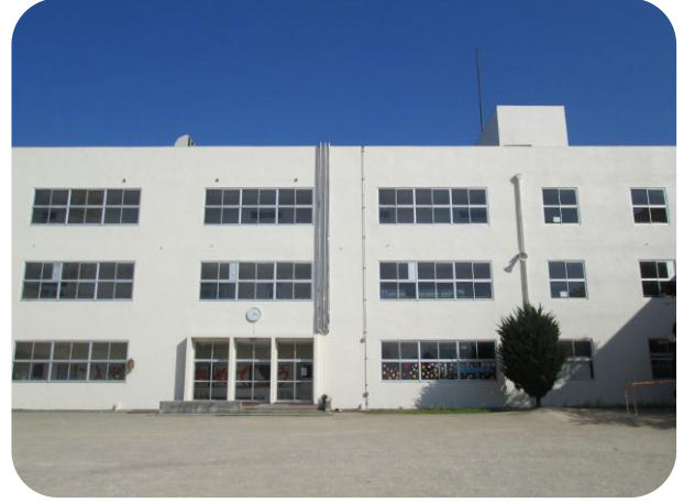
2 ふるさとの学び舎整備事業 城東小学校本館壁面改修後