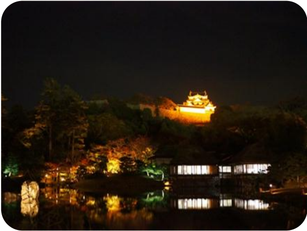
3 ふるさと彦根への思いやり福祉事業 彦根城オレンジライトアップ