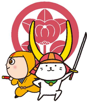
彦根市ふるさと納税