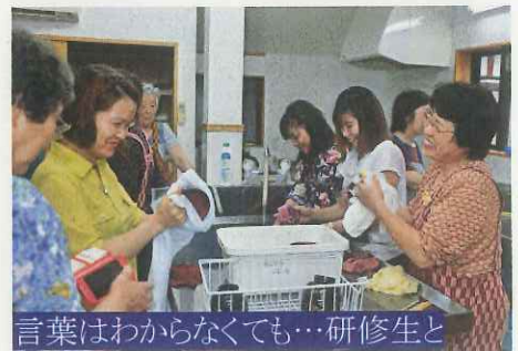
言葉はわからなくても…研修生と