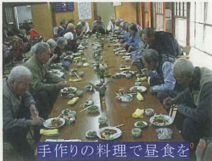
手作りの料理で昼食を