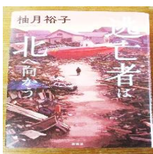
「逃亡者は北へ向かう」

★ 売れ筋の新書6冊を購入しました。貸出もできますのでご来館のうえ、職員にお声かけください。