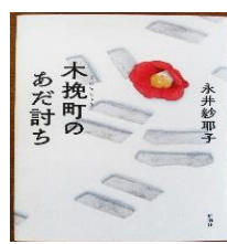
「木挽町のあだ討ち」