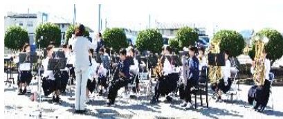
文化祭で集まったウクライナ募金 13,025 円 は、赤十字滋賀支部へお届けしました。