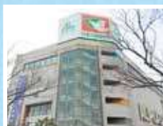
アル・プラザ彦根