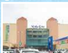
ビバシティ平和堂