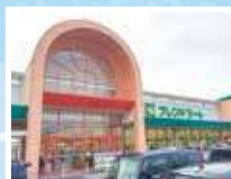
フレンドマーケット秦荘店