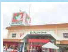
フレンドマーケット大藪店