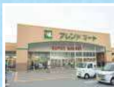
フレンドマーケット稲枝店