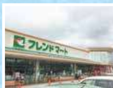
フレンドマーケット彦根地蔵店