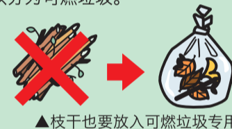
▲枝干也要放入可燃垃圾专用袋