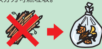
▲枝干也要放入可燃垃圾专用袋