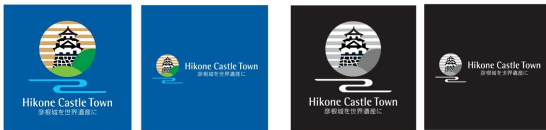
ネガティブ表示の例

ロゴマークの背景に色をつけ、英文ロゴとスローガンの文字を白抜きにすることができます。