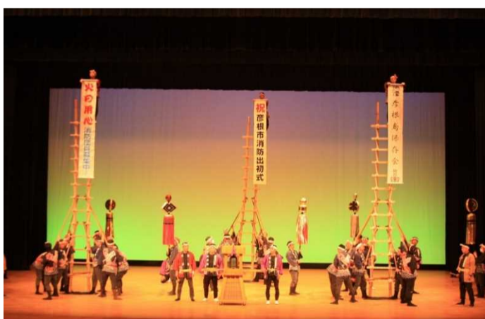
ひこね市文化プラザ (グランドホール)