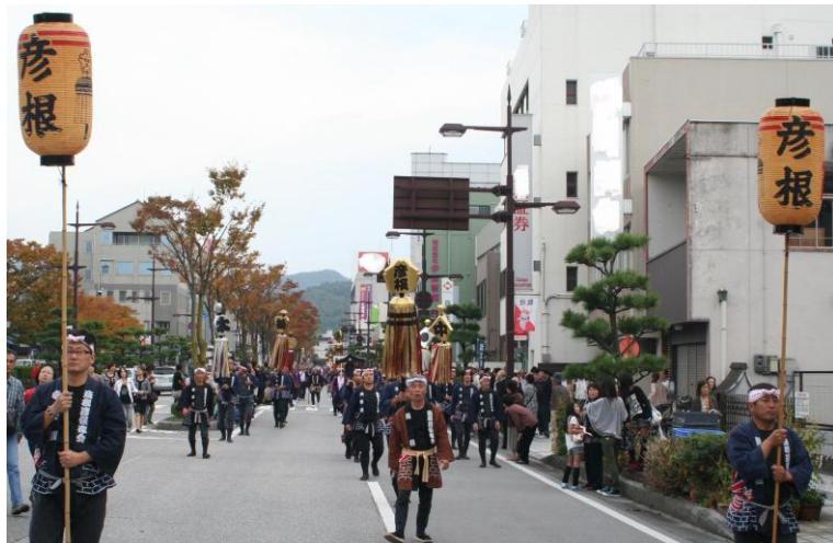
駅前通りパレード

今年も、彦根鳶保存会の活動を通じて彦根の伝統を感じてもらえるよう彦根鳶保存会一同がんばりたいと思います。