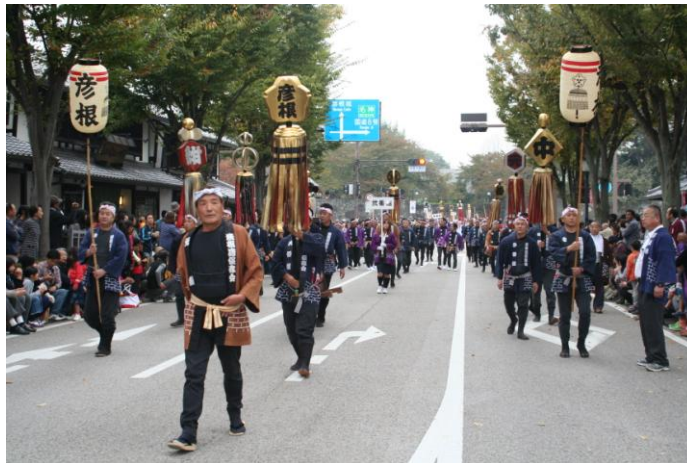
キャッスルロードパレード

今後も、彦根鳶保存会の活動を通じて彦根の伝統を感じてもらえるように、彦根鳶保存会一同頑張りたいと思います。