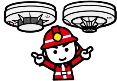
住宅用火災警報器の設置率の推移